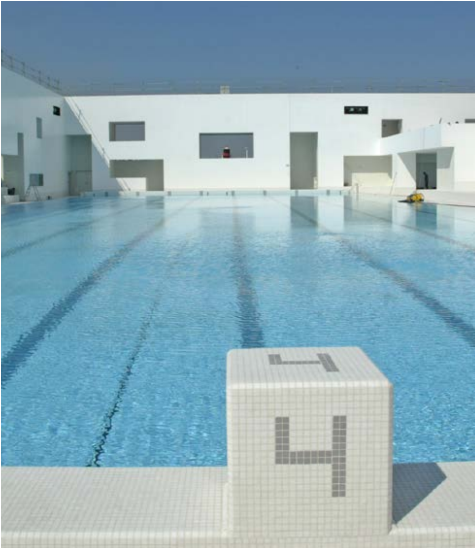
Piscine des Bains des Docks

« Petit Volcan » pour la salle polyvalente. D'autres activités occuperont des espaces périphériques aux deux bâtiments principaux, commerces, brasserie puis locaux associatifs.