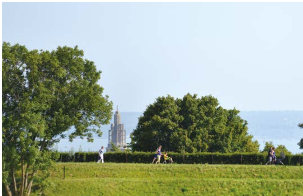
Les Jardins Suspendus