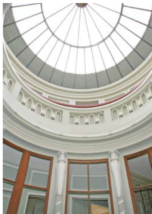
Maison de l'Armateur