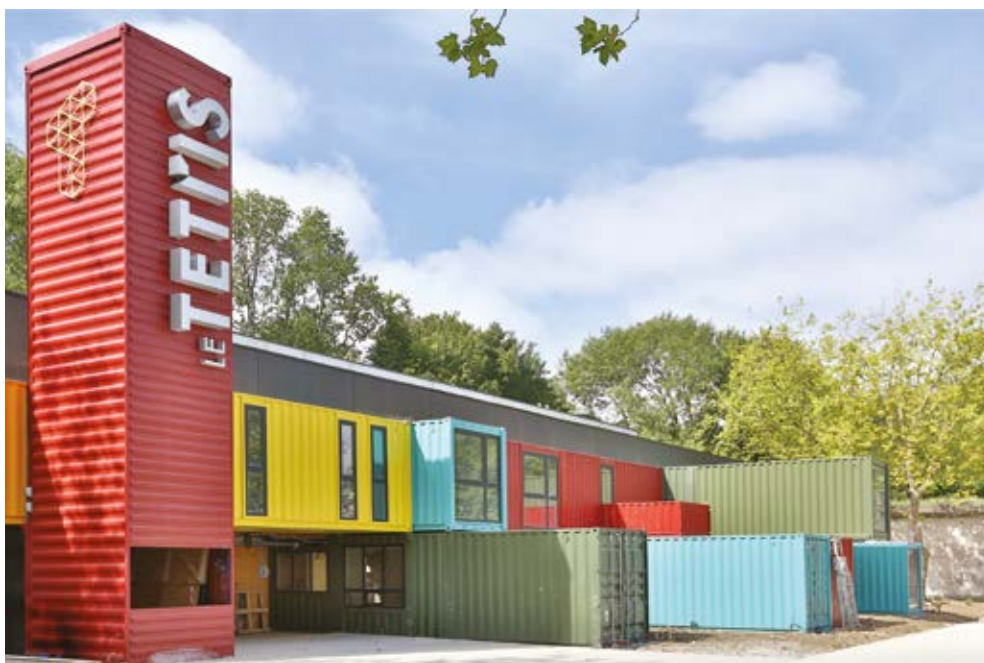
Réhabilitation Fort de Tourneville - Le Tétris

Déjà occupé par les Archives municipales et par plusieurs acteurs de la scène musicale havraise (Studio Honolulu, La Papa's et Ouest Park, I Love LH, Piednu...), le site du Fort accueille depuis 2013 deux nouveaux espaces dédiés à cet art : le Tétris, lieu pluridisciplinaire de création et de spectacle et le Sonic, pôle de répétition dédié aux musiques actuelles. Cette transformation du site se poursuivra, le fort devant à terme abriter d'autres projets liés au son et à l'image, au cinéma, aux arts visuels et à la créativité dans tous les champs des arts plastiques, au cours des prochaines années.