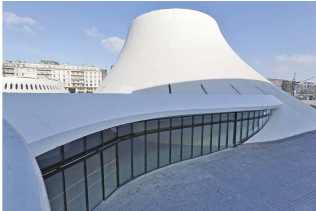
Espace Oscar Niemeyer

recouvertes de verrières, avec construction de deux parkings et d'un bâtiment neuf (Cinéma Gaumont et restaurants). L'organisation en rues et passages offre, depuis 2009, un cadre de balade shopping unique comprenant 60 enseignes et une promenade piétonne en bord de bassin bordée de restaurants. Architecte Bernard Reichen (Reichen & Robert)