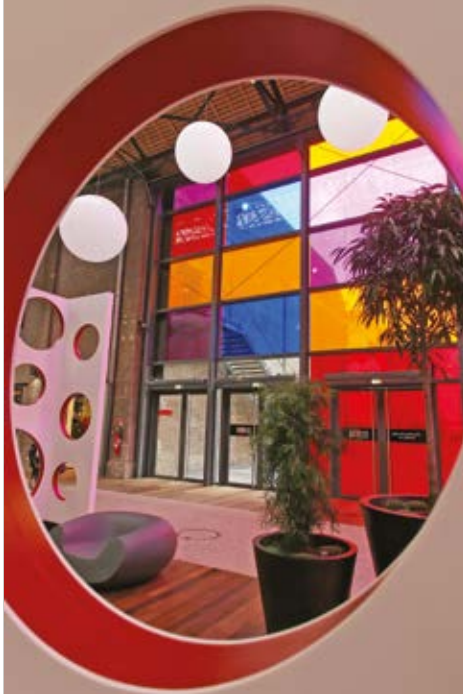
Les Docks Vauban