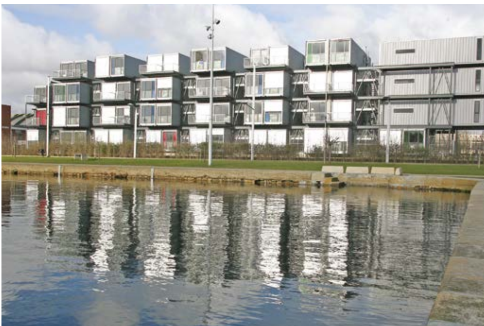
Cité A Docks