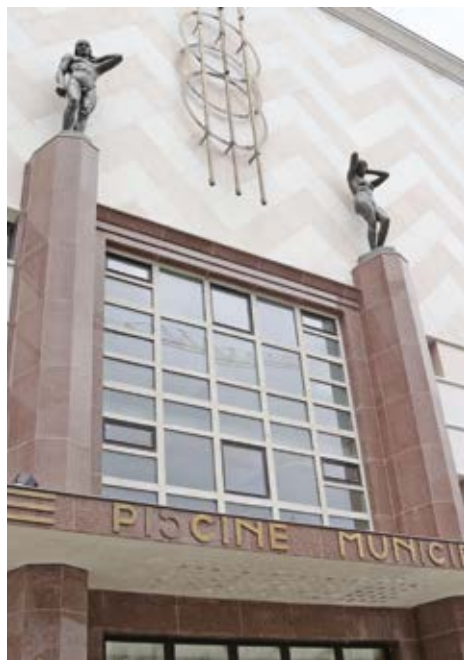
Piscine du Cours de la République