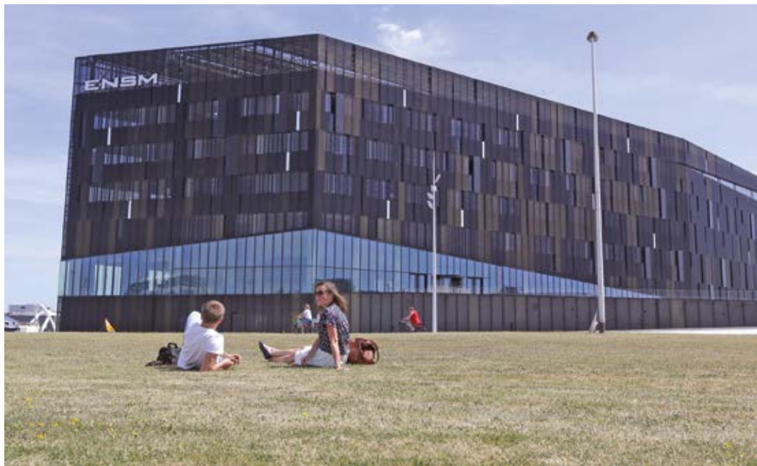
École Nationale Supérieure Maritime